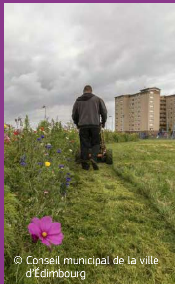
© Conseil municipal de la ville d'Édimbourg

Dans le cadre d'un effort visant à passer à une gestion extensive et plus respectueuse de la biodiversité des prairies gérées de façon intensive, la ville de Fribourg (Allemagne) a, dans de nombreux cas, remplacé le paillage par la tonte, qui est moins agressive pour la population de micro-invertébrés. La ville a également établi un système de pâturage de bétail (avec des moutons et des buffles d'eau) à certains endroits spécifiques au sein du territoire municipal (par ex. Rieselfeld, Schlossberg) en substitution de la tonte classique. De plus, la tonte a été réduite dans les prés urbains de dix fois par an à deux fois.